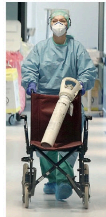
Un'infermiera in ospedale

Detto che i pazienti ricoverati in terapia intensiva sono 187 (invariati) e 1.357 quelli negli altri reparti Covid (+22), per quanto riguarda i ca-